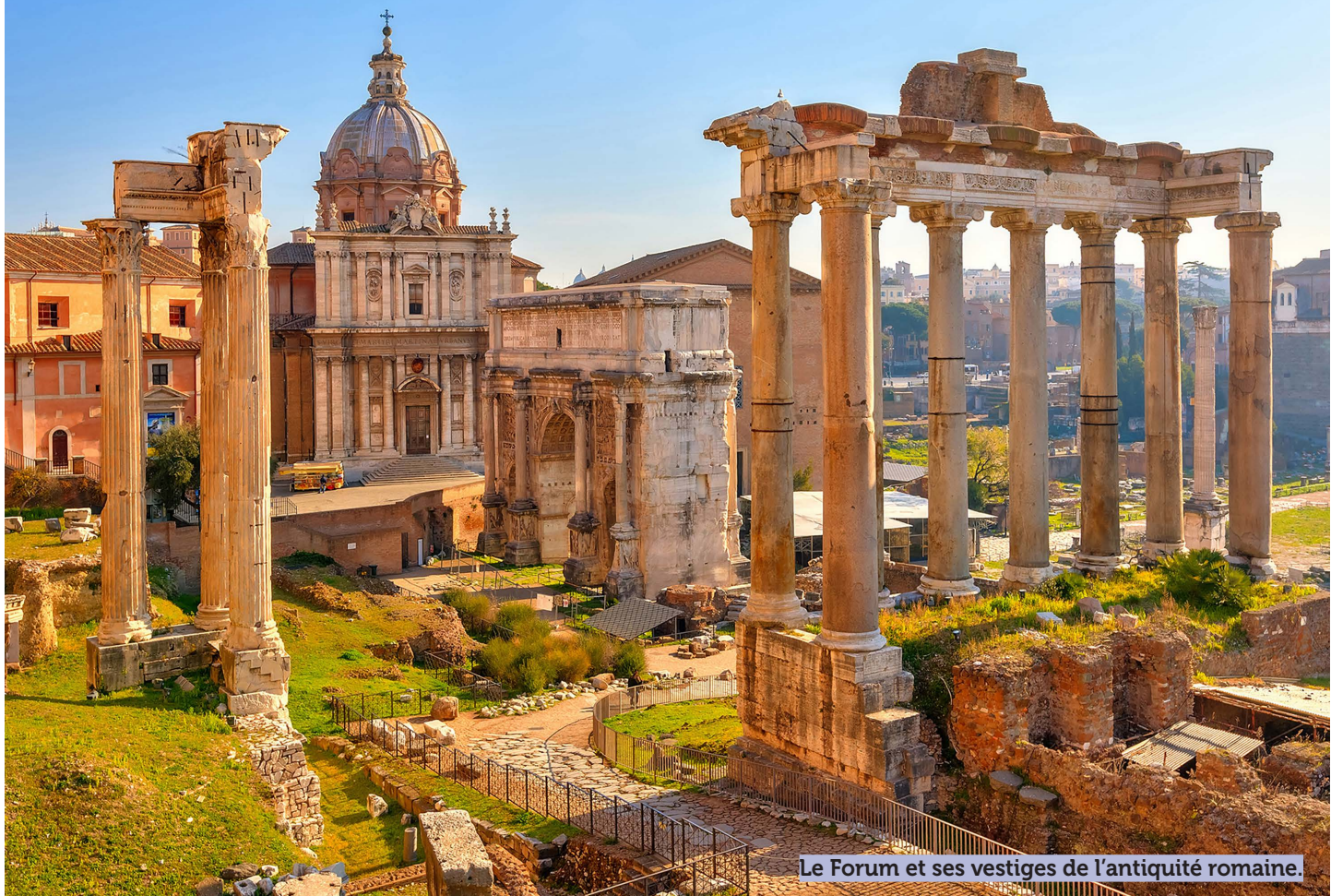
Le Forum et ses vestiges de l'antiquité romaine.

Site Internet: https://catholique-savoie.fr